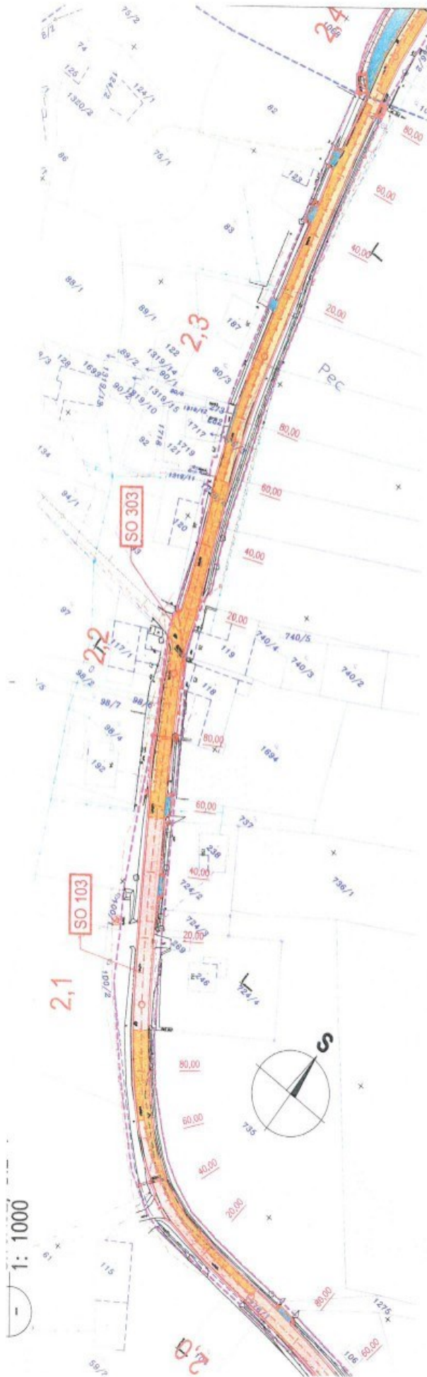
○ PŘEHLEDNÁ SITUACE Klad listů 1:20 000